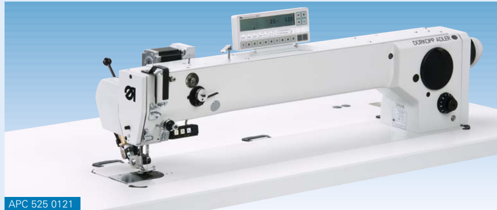
APC 525 0121