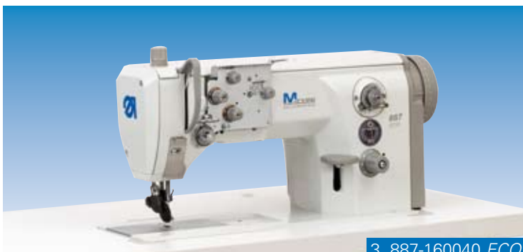
3. 887-160040 ECO