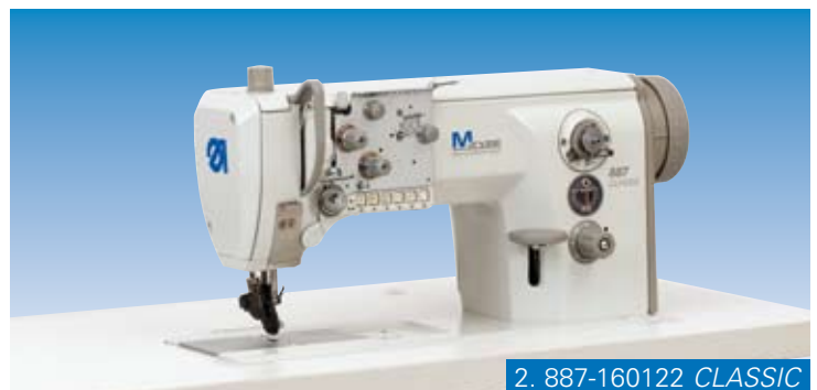
2. 887-160122 CLASSIC