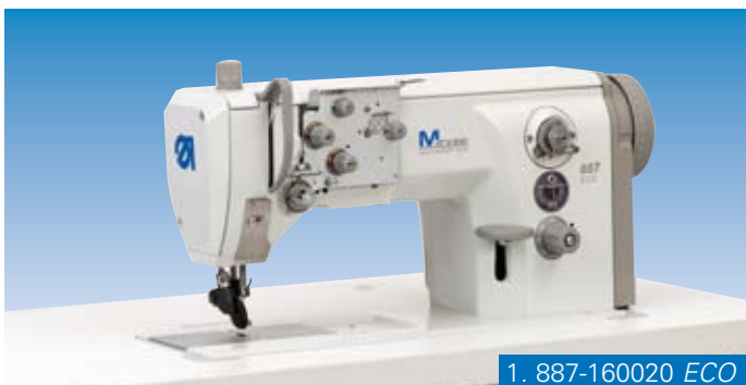
1. 887-160020 ECO

Grças a um aumento de aproximadamente 70% da capacidade de fio da canilha, o número de mudanças de canilhas pôde ser significativamente reduzido, mesmo no caso de utilização de linha de costura pesada.